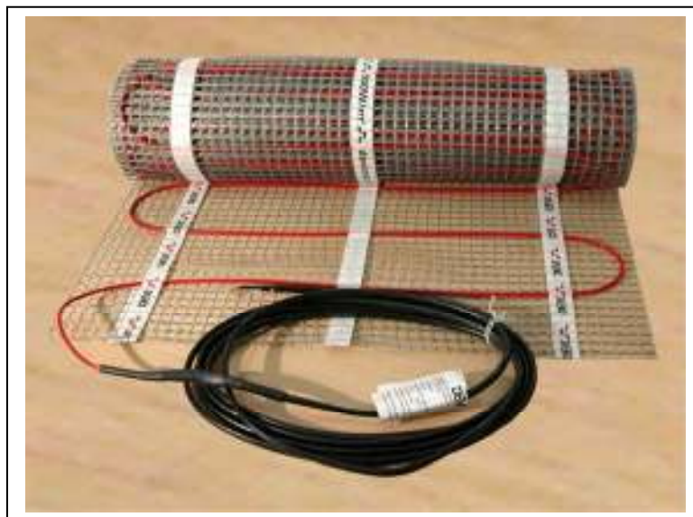
Рис. 1. Нагревательный мат Devimat™ DTIF.

Нагревательные маты Devimat™ DTIF (рис. 1) применяются для внутренней установки. Используются в ремонтируемых и тонких полах непосредственно под покрытие пола без формирования толстой цементной стяжки и устанавливаются в основном под плитку с плиточным клеем. Кабели предназначены только для прокладки в земле и бетоне.