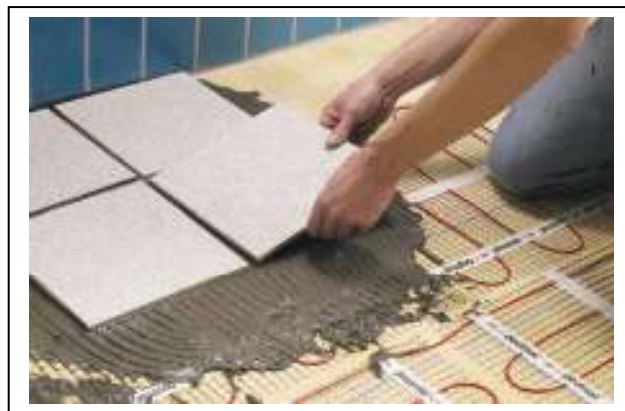
Рис. 3. Монтаж нагревательного мата Devimat™ DTIF в ванной комнате на старую плитку.