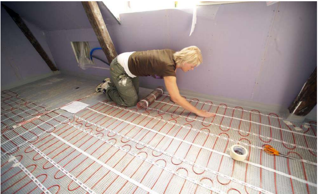
Рис. 3. Монтаж нагревательного мата DEVIheat™ 150S (DSVF-150) на основание из плит ГВЛ под плитку.

При выборе нагревательных матов необходимо учитывать допустимый разброс параметров, приведенных в технических характеристиках, и возможные отклонения напряжения питающей сети.