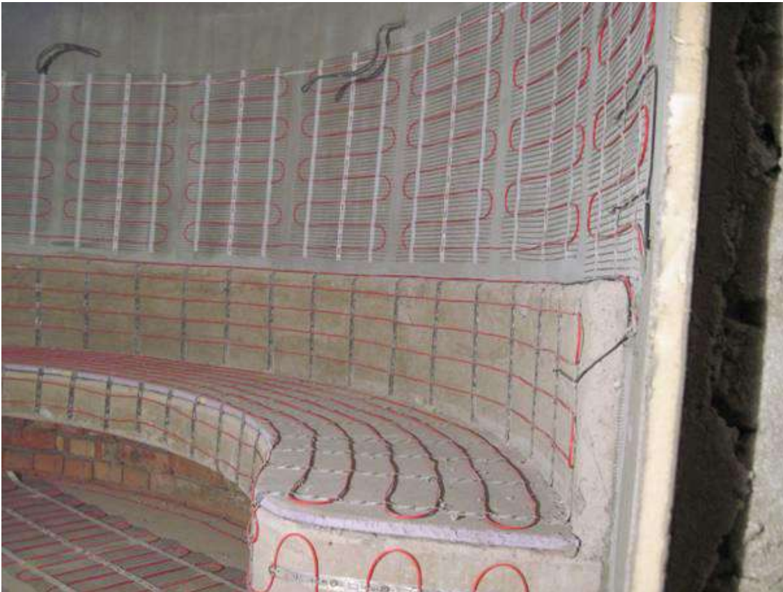
Рис. 4. Монтаж нагревательного мата DEVIheat™ 150S (DSVF-150) на стене в турецкой бане.